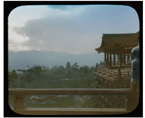
14. Kiyomizu Temple at Kyoto (清水寺、京都)