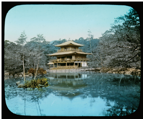
19. Kinkakuji Garden at Kyoto (金閣寺庭園、京都)