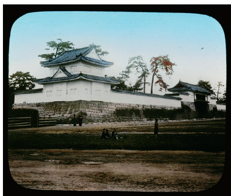
1. Nijo Castle at Kyoto (二条城、京都)

ガラス幻灯写真／ゼラチン乾板に手彩色 100 点組／1910-1923 年／東京都写真美術館蔵