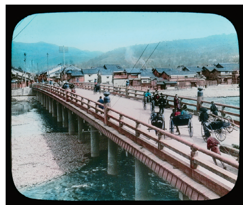
2. Sanjo Bridge at Kyoto (三条大橋、京都)