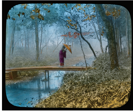
6. Shimogamo Park, Kyoto (下鴨神社、糺森、京都)