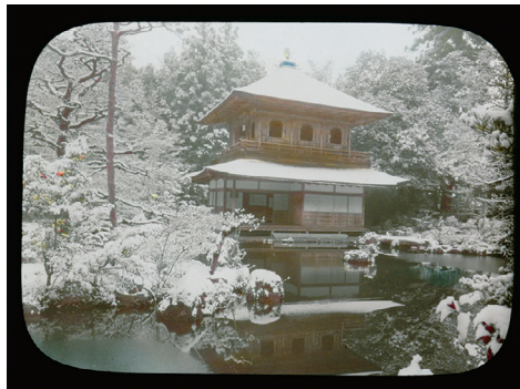
17. Kinkakuji Temple at Kyoto (銀閣寺、京都)