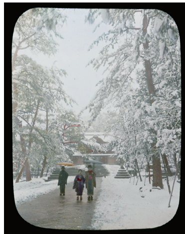
10. A Snow Scene of Higashi Otani at Kioto (東大谷の雪景色、京都)