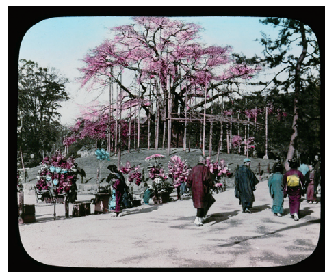
4. A Big Cherry Tree at Maruyama Park, Kyoto (円山公園の大桜、京都)