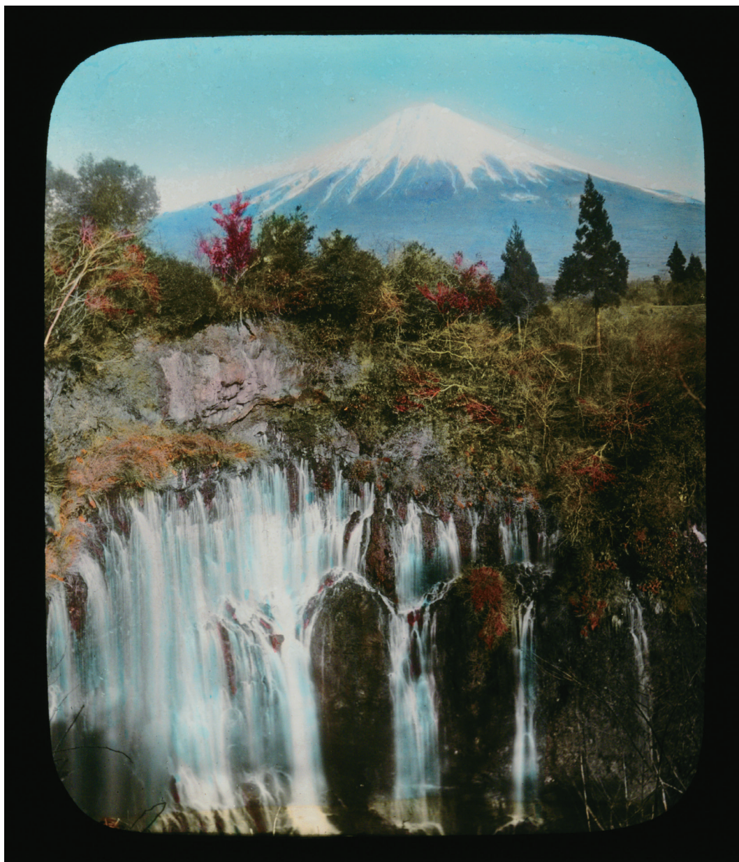
Fujiyama from Shiraito (白糸からの富士山) 高木庭次郎《日本風景風俗 100 選》より