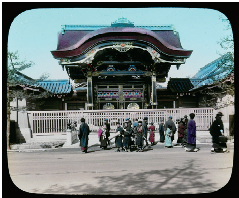
9. The Emperor's Gate of Higashi-honganji, Kyoto (菊の門、東本願寺、京都)