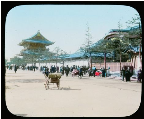
7. Gate of Higashi-honganji Temple at Kioto (東本願寺の山門、京都)