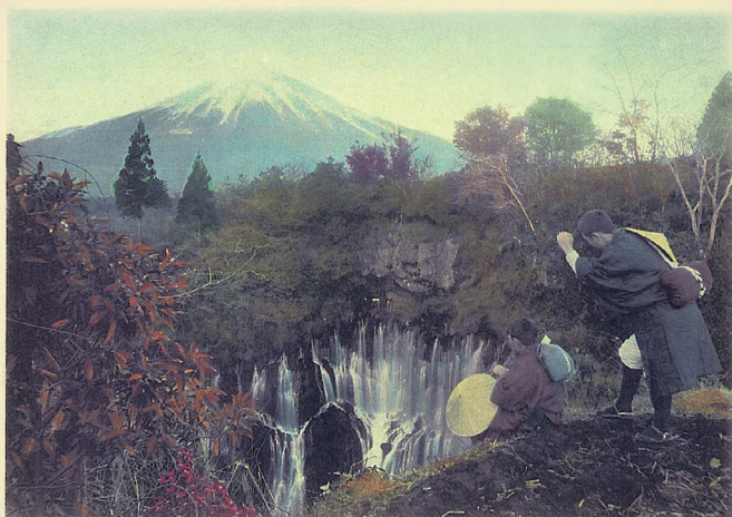
This Waterfall is known as the "White thread" Fall, by reason of the water escaping through natural perforations in the rocks. This Fall is situated amidst a jungle of forest growth (a particular beauty-feature of Japanese scenery), in all hues of variegation.

高木庭次郎 『A Wintry Tour Around Fujiyama (富士山周遊 冬の旅)』 玉村寫眞館, 1909 年より 国立国会図書館蔵