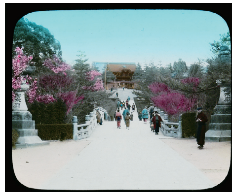
12. Nishi Otani Temple, Kyoto (西大谷、京都)