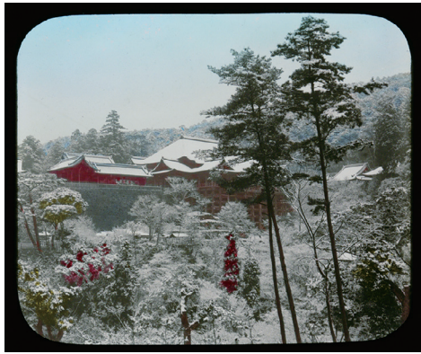
13. Kiyomizu Temple at Kyoto (清水寺、京都)