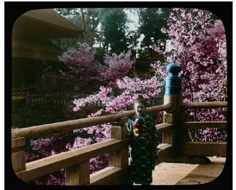
16. Cherry Blossoms at Kiyomizu Temple, Kyoto (清水寺の桜、京都)