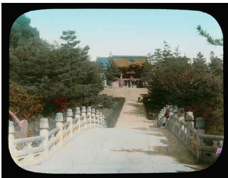
11. Nishiotani Temple at Kioto (西大谷、京都)