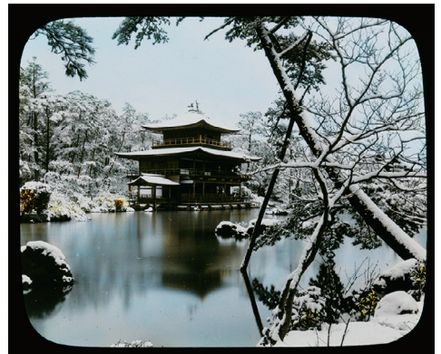
18. Kinkakuji Garden at Kyoto (金閣寺庭園、京都)