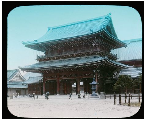
8. The Main Gate of Higashi-honganji, Kyoto (東本願寺、御影堂門、京都)