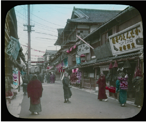
5. Shinkyogoku, the Theatre Street, Kyoto (新京極、劇場通り、京都)