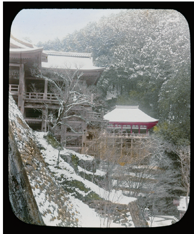
15. Kiyomizu Temple at Kyoto (清水寺、京都)