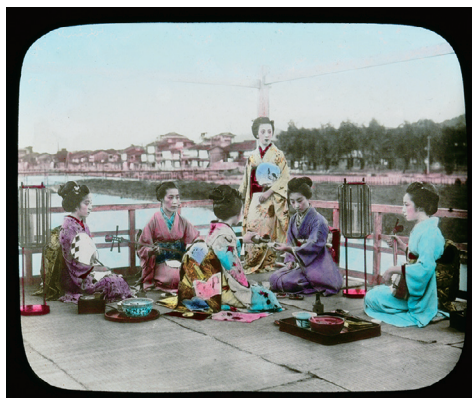
3. Geisha Girls Cooling Themselves On the Bench at Kyoto (川床で涼をとる芸者たち、京都)